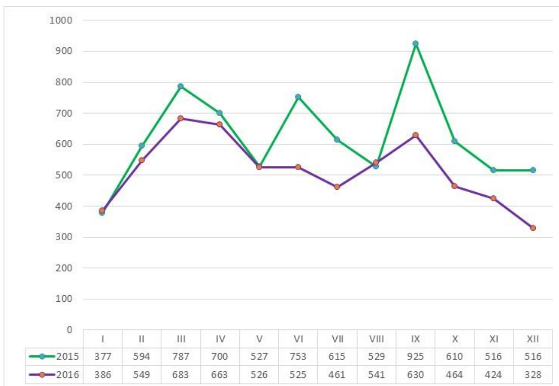
Wykres 5 Odływ osób bezrobotnych w powiecie czarnkowsko-trzcianeckim w latach 2015-2016

Tendencje napływu i odpływu nakładają się na siebie w tych samych miesiącach, co potwierdza, iż na zmianę w poziomie bezrobocia ma sezonowość prac i napływ absolwentów szkół.