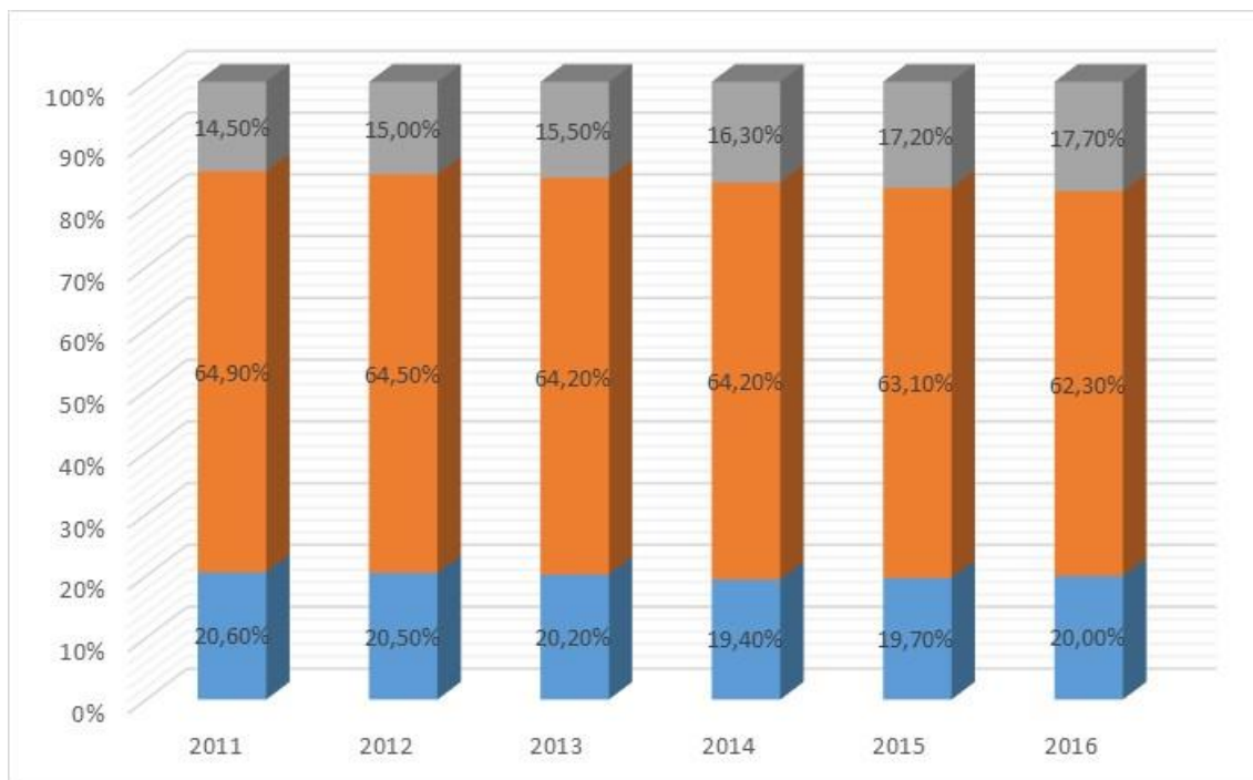
Wykres 1 Ludność powiatu czarnkowsko-trzcianeckiego według wieku w latach 2011-2016 – udział procentowy w ogólnej liczbie mieszkańców

Źródło: informacje z ewidencji ludności urzędów miast i gmin powiatu czarnkowsko-trzcianeckiego